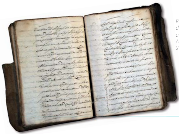
Registro con atti di lite relativi al territorio di Miazzina, ASCMIAZZINA, XVIII secolo ca. f. 6.